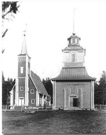
Muhoksen kirkko ja tapuli.