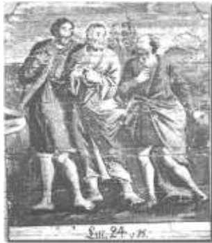
Emmauksen tiellä. Seinämaalauks sakaristossa.

Muhoksen kirkko sisältä 1800-luvun lopulla uusgoottilaisessa hengessä toteutetun korjauksen jälkeen.