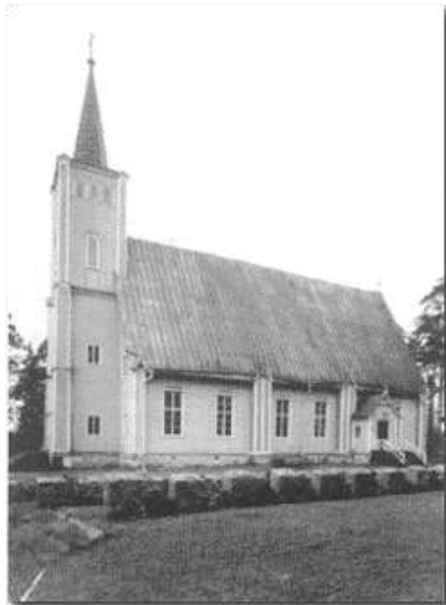
Muhoksen kirkko etelästä.