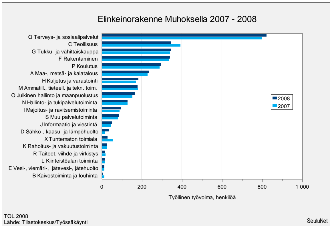
Kuva 2 Muhoksen elinkeinorakenne 2007-2008