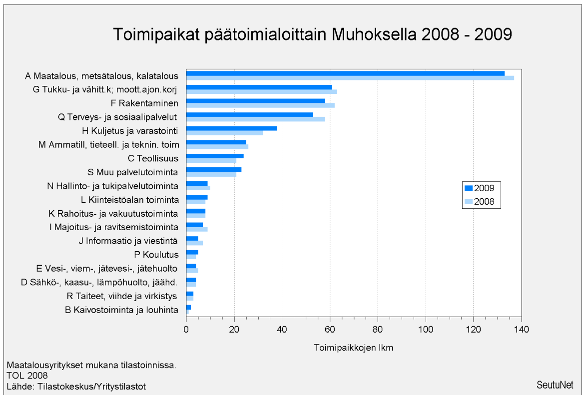
Kuva 3 Muhoksen toimipaikat 2008-2009